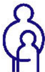
Utgitt, første gang desember 2004, revidert desember 2006 Bjerch Trykkeri AS