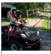
Rapport om Hurdalssenteret side 6