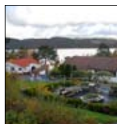
Aktiv familie- ferie Solvik side 10