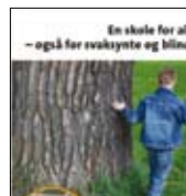
En skole for alle side 17