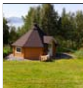
Familiesam- ling Evenes side 8