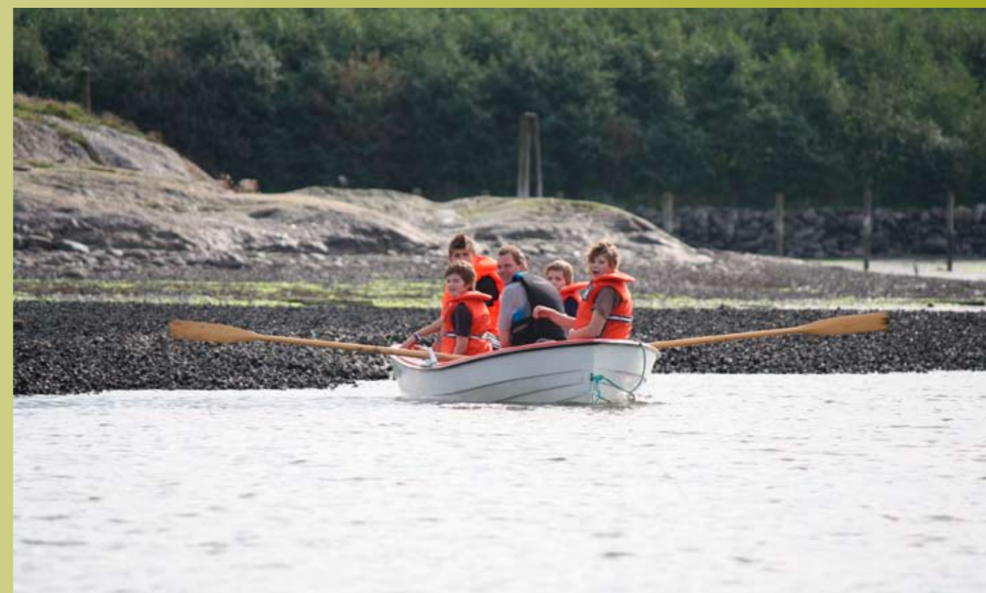
Glade folk ved blåskjellbankene