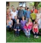
Skriveleir 4 - stor- begivenhet over side 14