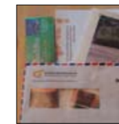
NBF's inter- nasjonale arb. side 11