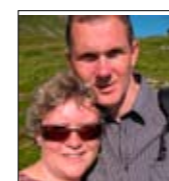
Kyss klapp og klem på dekk side 8