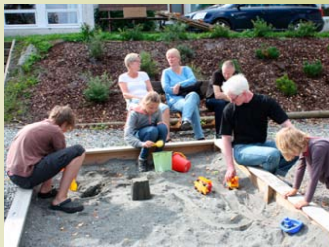
Søndagskos i sola

Søndag tilbrakte vi på leirstedet med robåter på fjorden og prat i sola. Noen spilte kubb på gresset og alle nøt ro og fred. Etter kjøttkakemiddagen ble de som skulle reise hjem med tog kjørt til stasjonen. De fleste av oss var hjemme i 16-tida og godt fornøyde med en aktiv helg