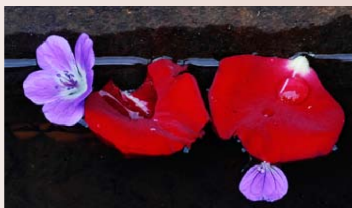
Illustrasjon: Roseblader

Sammen skal vi ta vare på fellesskapet som finnes i Assistanse også i fremtiden.