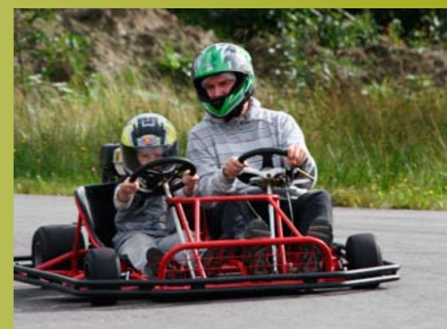
Far og sønn i tvillingkart