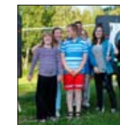
En sommer er over side 16