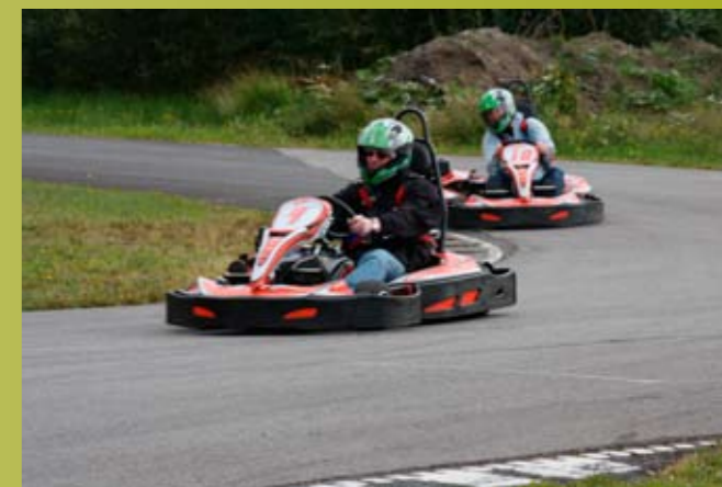
To fornøyde fedre