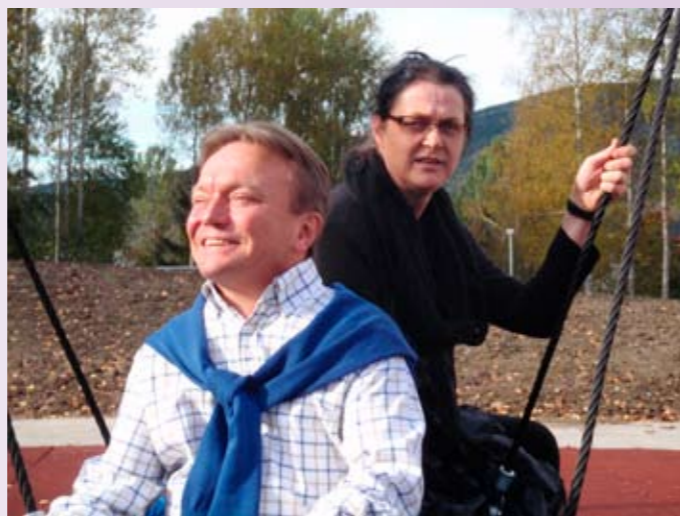
To fornøyde ledere etter at vedtak er fattet

Som leder er det ikke med vemod, men med stolthet jeg formidler dette. Vi som har hatt verv i Assistanse de siste årene tok en modig og real beslutning når vi fremmet forslaget om å legge ned egen organisasjon og ”fusjonere” med Blindeforbundet. At det først ble nesten enstemmig vedtatt hos oss og deretter så godt mottatt i Blindeforbundet, borger for gode arbeidsvilkår fremover.